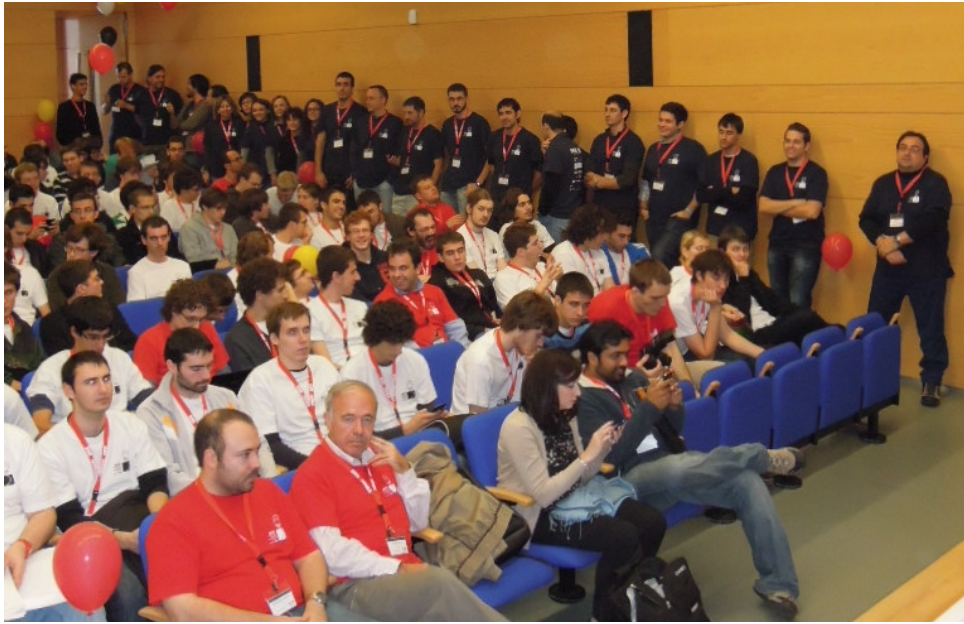
Figura 2: Momentos antes de la entrega de premios en SWERC 2012.

fraestructura y la dependencia que de ella se tiene. La infraestructura incluye los ordenadores que utilizarán los equipos participantes durante las cinco horas de la competición más el sistema de jueces automáticos. Un fallo durante la competición puede ser motivo de suspensión y aplazamiento, lo que implicaría el planteamiento de un nuevo conjunto de problemas.